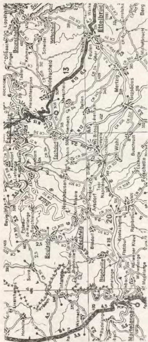
Mapa da parte de Luxemburgo com a aldeia Nei-Bresil

Em consequência das transformações da estrutura econômica e social, do desemprego, da absorção das indústrias agrícolas caseiras pela industrialização e do uso das máquinas a vapor, verificou-se geral empobrecimento da população e, sendo assim, facilitou muito o trabalho dos agentes do Major Schaeffer, que percorriam o país em todas as direções, à cata de imigrantes voluntários, com os quais fechavam contrato.